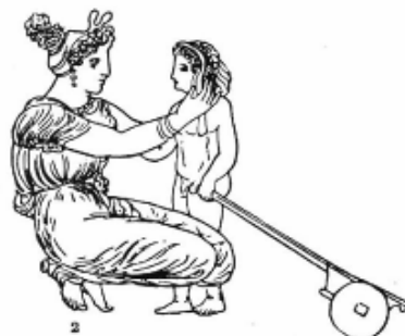
4. Gyermekét játszani küldő görög édesanya

A Törvényeket olvasva képet kaphatunk arról, hogy milyenek látta a görög bölcsele a gyermekkor egyes szakaszait, és milyen nevelési módszereket javasol a különböző életkorú gyerekek esetében. Platón itt található gondolatait csoportosítja a következő táblázat: