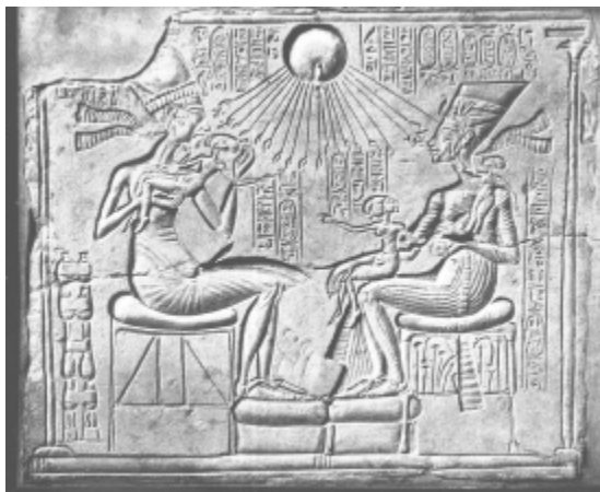
2. Ekhnaton fáraó családja körében

Egyiptomban a kisgyermeket ábrázoló festmények bősége arra enged következtetni, hogy ebben a kultúrában megbecsült érték volt a gyermek. Így például az Ekhnaton fáraót és feleségét Nofretitit ábrázoló falfestményen látható meghitt családi együttlét arról árulkodik, hogy a gyermekek iránti pozitív érzelmek nagyon is jól ismertek voltak ebben a kultúrában is.