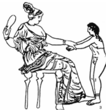
5. Gyermekét fenyítő görög édesanya

A verés hétköznapi gyakorlat volt, de a filozófus szerzők gyakran intették önmérsékletre a szülőket. (Ekkor még nem létezett a középkori dogma, amely a gyermek lelkében lakozó gonosz elleni harccal indokolja majd a gyakori testi fenyítést.)