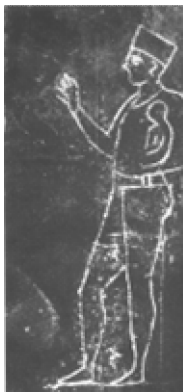
1. Gyermek feláldozására készülő karthágói pap

Karthágó népe sajátos atavisztikus kivételt képezett egy olyan korban, amelyben a gyerekáldozatot más népek már – a Kr. e. 2. évezred vége óta – jelképes rítusokkal vagy helyettesítő áldozatokkal váltották fel.