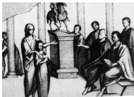
6. Római édesanya kislányát iskolába kíséri

A rómaiak gyermekik nevelése közben figyeltek azok – felnőttektől eltérő – sajátosságaira is, többször említik a gyermekek „ kialakulatlanságát ”. A görögökhöz hasonlóan észrevették a gyerekek játékos kedvét : már a csecsemőt csörgőkkel, babákkal ajándékozták meg. Másfelől viszont – a görögöktől eltérően – nagyobb jelentőséget tulajdonítottak a gyerekekben rejlő természetes kíváncsiságnak , természetes emlékezőtehetségnek és versengési szellemnek . Mindezen felül már negatív tulajdonságokat is felfedeztek bennük: egyes szerzők tudatlannak, naivnak, sőt ostobának nevezik őket. A korabeli szövegekben sokszor fordul elő engedetlen, hirtelen haragú, irigy gyerekről szóló híradás. Úgy tűnik, a rómaiak több negatív jellemző vonást tulajdonítottak gyermekiknek, mint a görögök. A rómaiak ugyanakkor jobban hangsúlyozták a gyermeki természetből adódó utánzási hajlamot , mint a görögök, és jóval gyakrabban említették a gyermek természetes ártatlanságát . Ez utóbbi a sztoicizmus és a kereszténység hatását tükrözi a római mentalitásban.