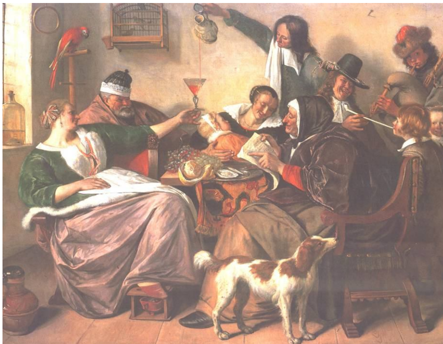
6. Jan Steen: Ahogyan az öregek énekelnek... (1663-1665)

jellemét az öröklés határozza meg, vagy pedig a nevelés és a környezet? A 16-17. század moralista szerzői és pedagógiai írói egyre többször figyelmeztetik a szülőket alapvető kötelességükre: saját életmódjukkal követésre méltó példát kell nyújtaniuk gyermekeiknek, hiszen azok utánozzák a felnőttek viselkedését. Steen a példaadás és utánpótlás mozzanatát ragadja itt meg – meglehetősen fonák módon. Az apa ugyanis – aki nem más, min ő maga – kibújik a tradíciók által diktált megállapodott és szigorú atya szerepéből. Helyette játszópajtása lesz gyermekének, akit a felnőtté válás felé vezető út egy sajátos rítusaként – játékosan ugyan de mégiscsak – pipázni tanít. Amíg az apa távolítja magától hagyományosan autoriter szerepét, a nagypapa átvenni látszik azt: legalábbis erre utal fején a fiatal apák szokásos viselete, a díszes sapka (kraamherenmuts). A festő gunyoros szkepticizmussal foglal állást az öröklés versus nevelés-vitában: a családban látott fonák példák (mulatozás, ital, dohányzás stb.) ellenére a gyerekekből – feltehetően – mégis ép és egészséges felnőtt lesz.