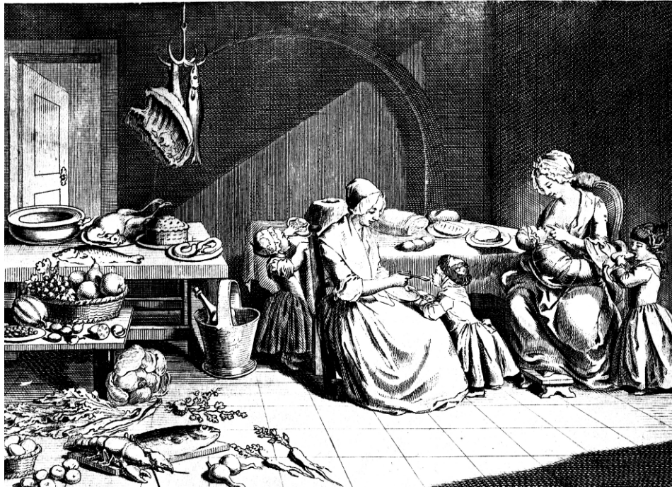
7. Chodowiecki: A főbb élelmiszerek (I. tábla)

Johann Bernhardt Basedow Elementarwerk, azaz: Elemi ismeretek tára című könyvéhez készült. Azt egészítette ki oktatásban használatos szemléltető anyagként.)