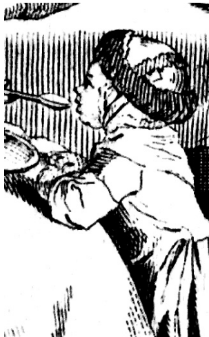
8. Chodowiecki: A főbb élelmiszerek (I. tábla) (részlet)

A Chodowiecki-rajz kinagyított részletén jól látható a német nyelvben „Fallhut”-ként ismert fejfedő: