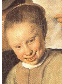
4. Jan Steen: A büntető tanító (1663-1665) 5. Jan Steen: A büntető tanító (részlet)