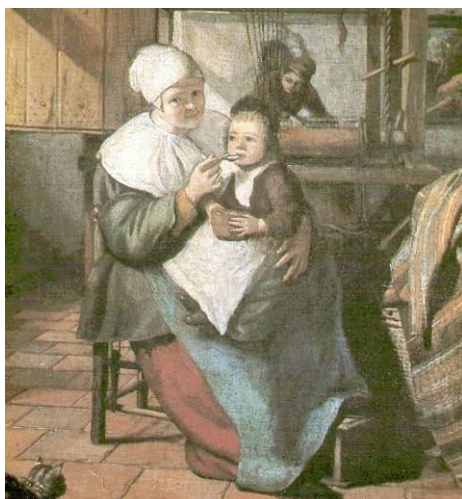
Isaak Koedijk (1617/8-1668?): Takácműhely

Koedijk kortársa, Jan Steen (1626-1669) leideni festő képein gyakran látunk gyerekeket. Steen a németalföldi festőknek abba a csoportjába tartozik, akiknek tehetsége különösen a hétköznapi jelenetek megkapó ábrázolásában nyilvánult meg. (E tekintetben Rembrandt és van Hals nevével szokták együtt emlegetni.) Szívesen ábrázolja az élet visszásságait, jót mulat az emberi gyarlóságokon. Fogékonysága a humor, a komikum iránt Molière stílusára emlékeztet. Derűs életszemléletét nem veszítette el, noha az élet nem mindig volt kegyes hozzá: festői pályafutását többször fenyegette az anyagi csőd. (Időnként – apja foglalkozását követve – még sörfőzőként és kocsmárosként is szerencsét próbált.)